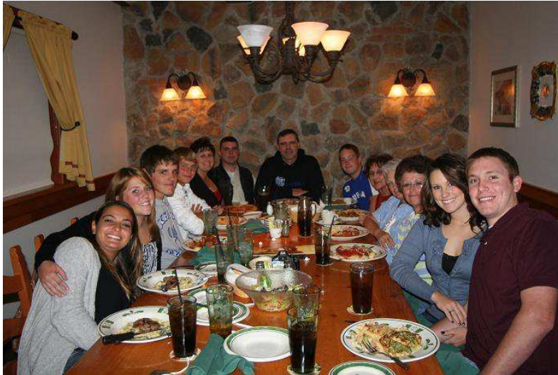
meine amerikanische Familie beim Essen beim Italiener

An meinem Geburtstag haben wir mit der Familie (Eltern, Kinder, Oma, Neffe und drei Freunde der Familie) gefeiert.